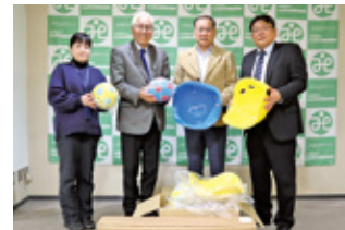
⑰ 株式会社 デンソーテン