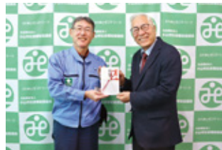
⑤ アルテミラ株式会社 小山工場