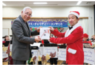
② 小山市交響吹奏楽団