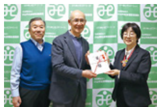
① 公益社団法人 小山市シルバー人材センター