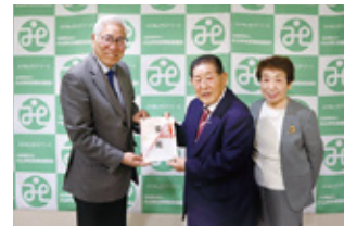
⑬ 株式会社 大都産業