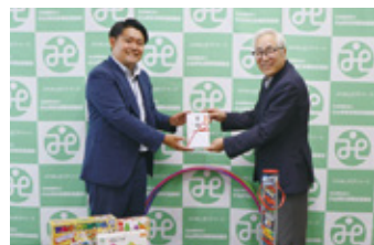
⑤ ナカノ薬品労働組合 ※対象期間:令和7年7月1日~9月30日(寄付順・敬称略)