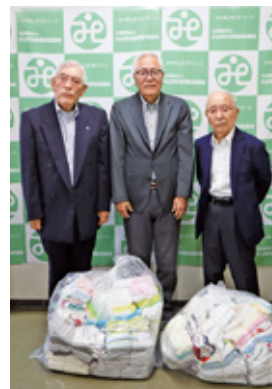
⑪ 栃木県退職公務員連盟小山支部