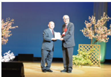
③ 宇野音楽院 カラオケ教室