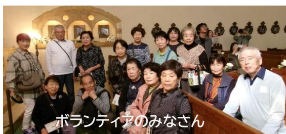
ボランティアのみなさん