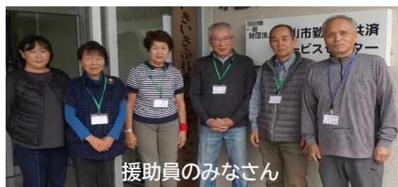
援助員のみなさん