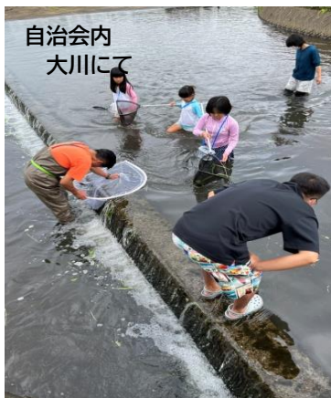
自治会内 大川にて