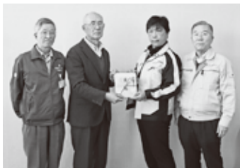
① 公益社団法人 小山市シルバー人材センター