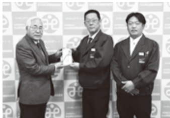
⑬ 関東西濃運輸労働組合 小山支部