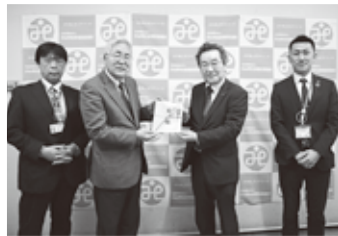
㉒ 栃木ダイハツ販売株式会社