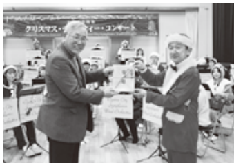
④ 小山市交響吹奏楽団