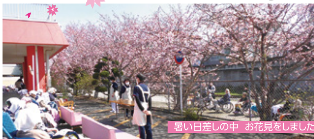
暑い日差しの中 お花見をしました。