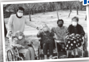
美しが丘公園桜の花見