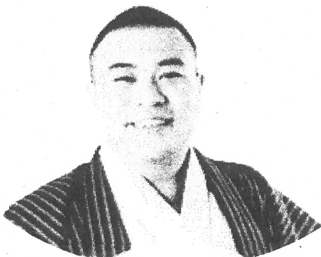
落語家 円楽一門会所属