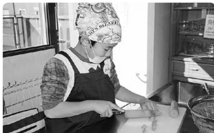
カレーも作りました。お鍋に入れてグツグツ中