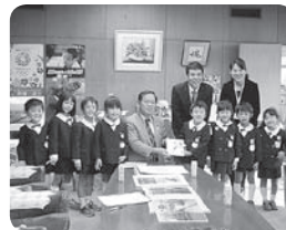
どんぐり基金寄付金として