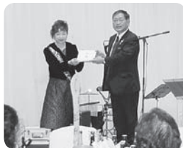
チャリティーパーティー 寄付金