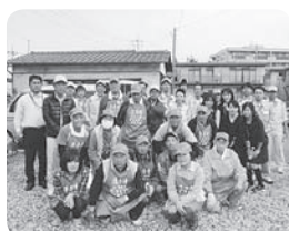
スモーキンクリーン キャンペーン