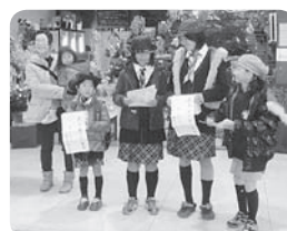
どんぐり基金寄付金として