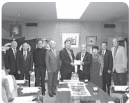
第23回大山歌謡教室 発表会