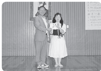
社協福祉活動のために