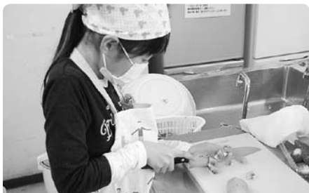
ケーキのデコレーション用にフルーツをカット中