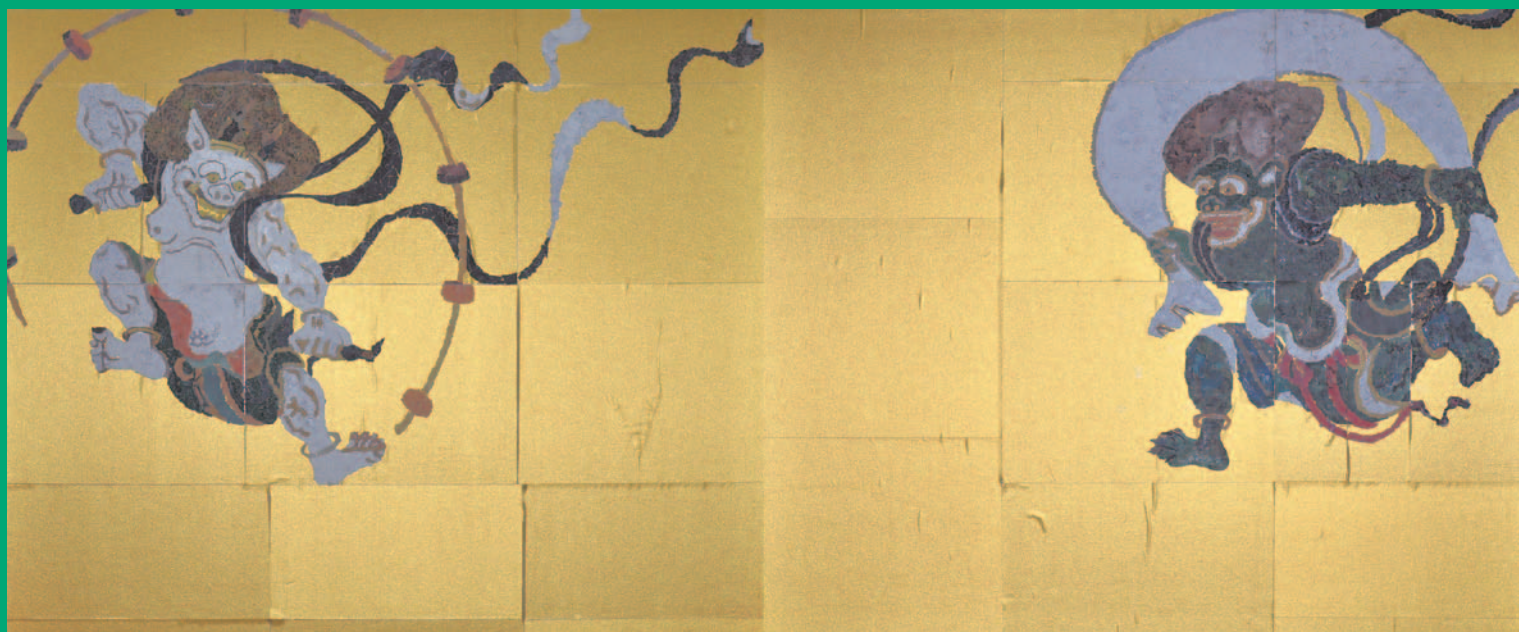
小山第三中学校 特別支援学級生徒制作「風神雷神図屏風」