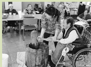
お年寄りと共に餅つきを行いました。