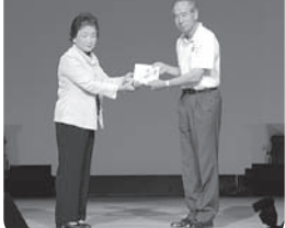
チャリティーカラオケ 発表会