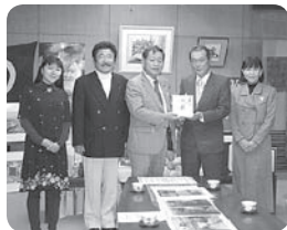
どんぐり基金寄付金として