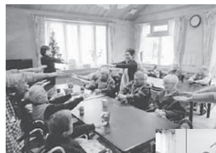
▲皆さん元気にリハビリです!