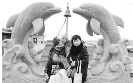
イルカの銅像の前で記念撮影