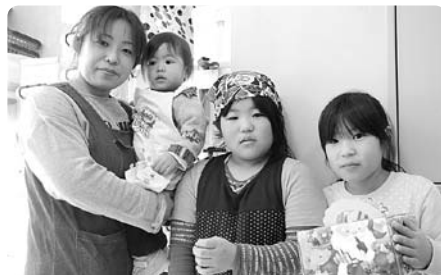
作ったケーキはサンタさんの箱に入れてお家へ