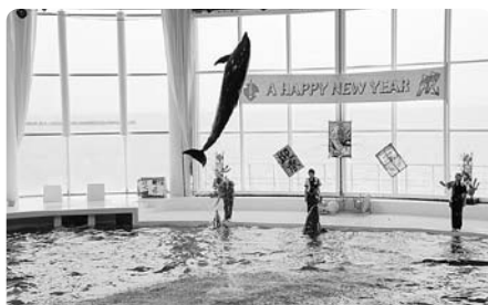
イルカの大きなジャンプ中