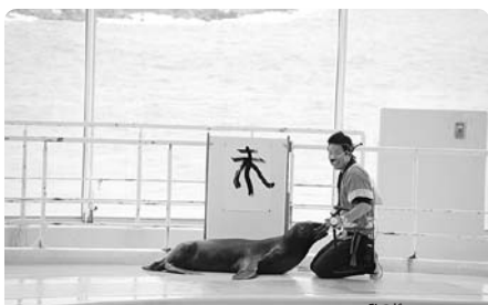
アシカの書初め! 今年の干支の「未」です