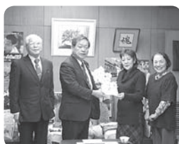
ヒューマンフェスタ