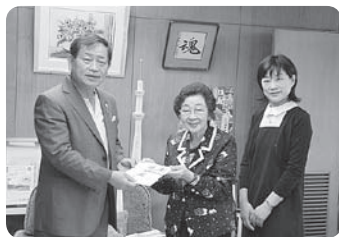
どんぐり基金寄付金 として