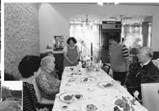
▲グループホーム誕生会 (ご家族・入居者・職員とともに) 喫茶かをんを貸し切った誕生会 でした