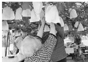
▲ぶどう狩りを楽しむ皆さん