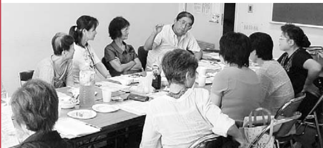
9月4日(木)に開かれた家族の集いの様子。この日は、精神障がい者の家族会「やしお会」との交流会が開かれていました。

同じ立場の人や介護を経験した人と、お茶を飲みながらゆっくりお話しすると、心がなごみ、「自分だけではない」と勇気づけられます。「また来たい」と思う…そんな集いを隔月で開催しています。