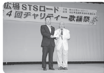
第4回チャリティー歌謡祭 での募金として