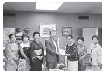
どんぐり基金寄付金 として