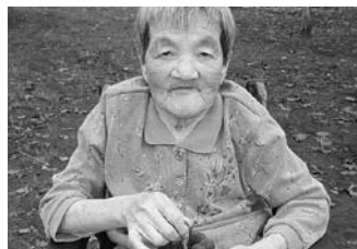
葡萄狩りにいきました