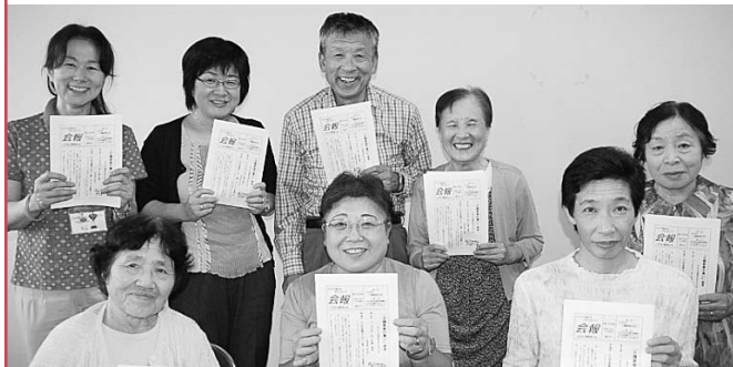
会報第159号発行のために集まった会員の皆さん。刷り終わったばかりの会報を手に。(10月2日(木) 市保健福祉センター)

介護の悩みや体験を綴った会報を隔月で発行し、会員に送っています。中々家庭を空けられない会員のために、会報を通じて交流し、互いに支え合うことを活動の中心としています。会報を読むことで、「離れていても一人ではない」と感じてもらえるような温かい会報づくりを続けています。