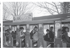
わんぱく公演(童心に帰って)