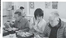
キッチン手作りの松花堂弁当持参で下妻道の駅へ