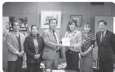
公民館まつり収益金