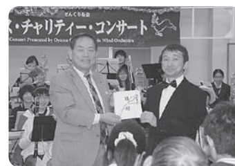
クリスマスチャリティーコンサート収益金