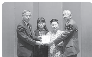
どんぐり基金寄付金