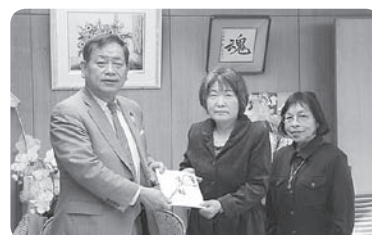
公民館まつり収益金