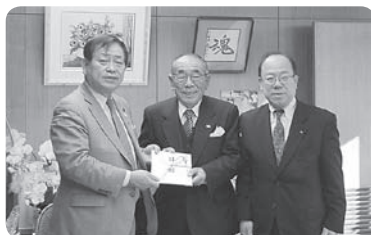
地域社会福祉の一助として