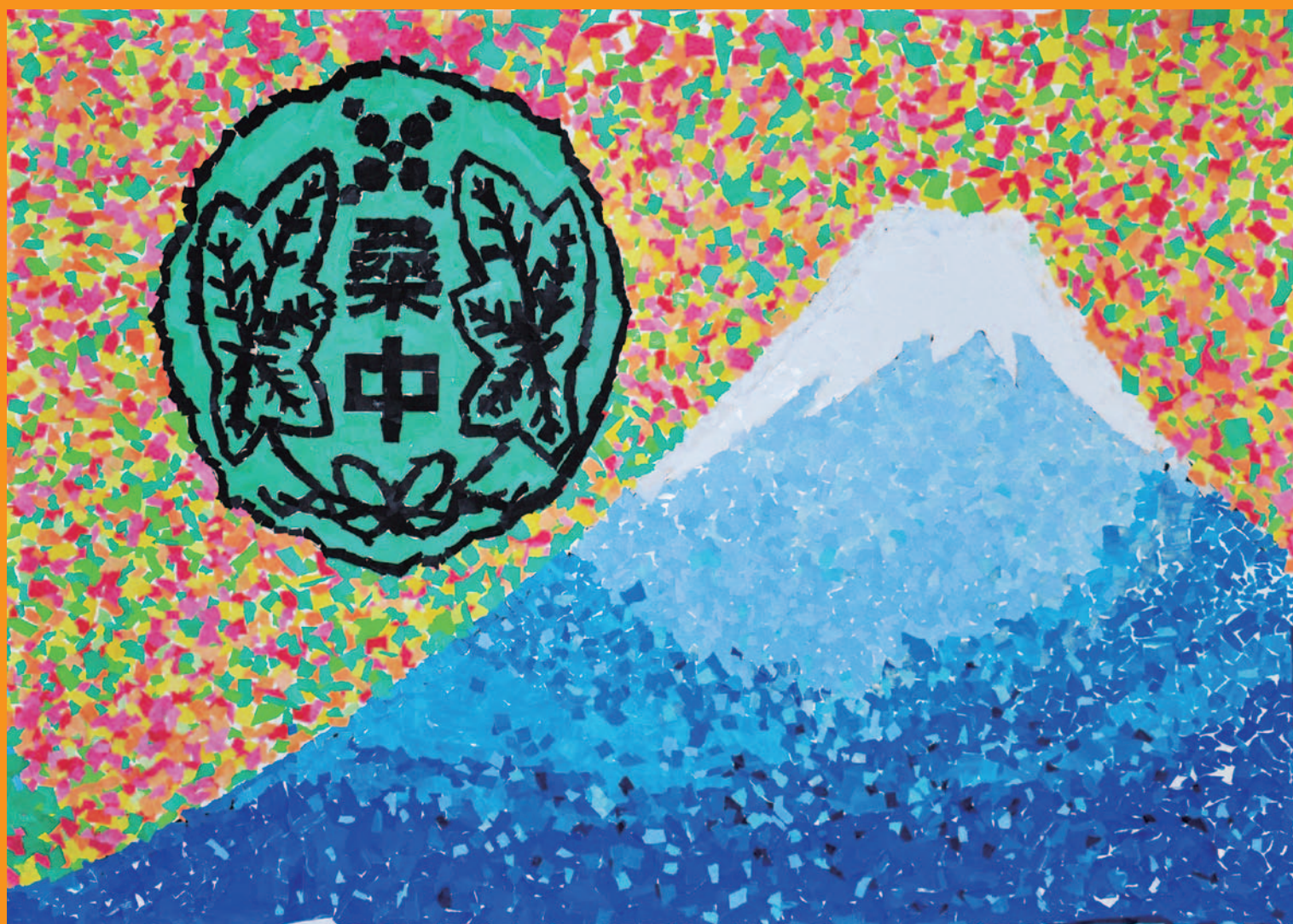
桑中学校特別支援学級生徒のみなさんによる合同作品