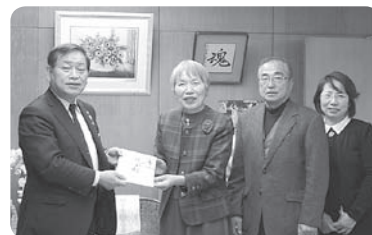
おやまーるまつりバザー収益金