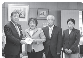
公民館まつり収益金