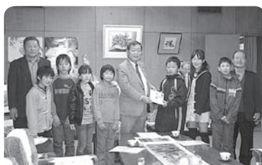
どんぐり基金寄付金として