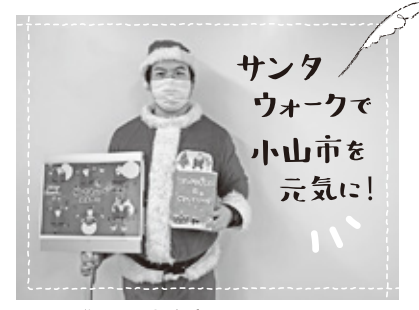
≥ 22 御殿町商店会