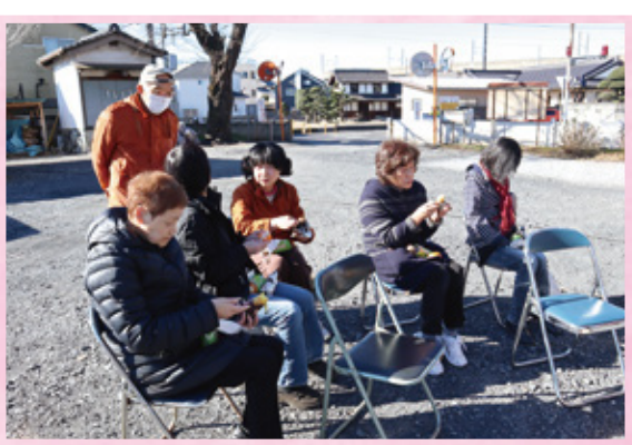
三峯流 つながりづくり ―