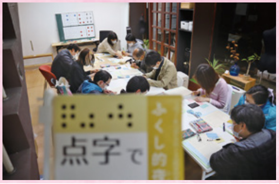
点字で名刺の魅力アップ講座 ―― 5ページ