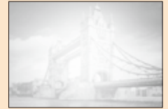
明るすぎると見えなかったり