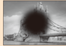
中心が見えなかったり