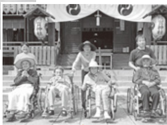
須賀神社へコロナ終息を 祈願してきました