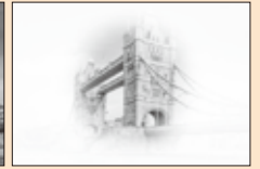
中心しか見えなかったり