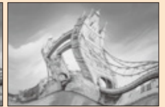
ゆがんで見えたり