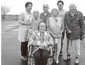
渡良瀬遊水地コウノトリ 観察場所へ行きました