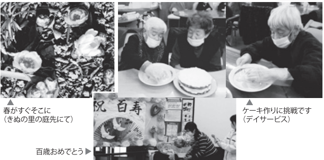
春がすぐそこに (きぬの里の庭先にて) 百歳おめでとう ケーキ作りに挑戦です (デイサービス)