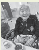
お汁粉を食べました

提供可能サービス ・特別養護老人ホーム・デイサービスセンター ・ショートステイ ・居宅介護支援事業所