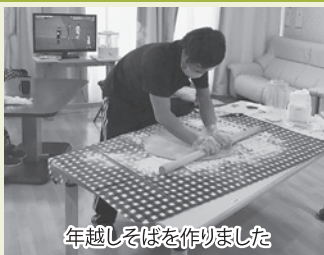
年越しそばを作りました