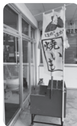
焼いも大会・じゃがバター大会