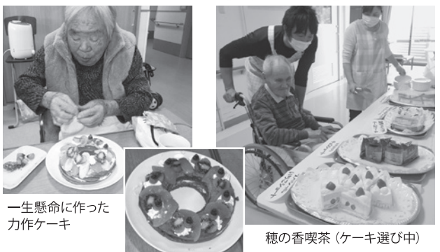
一生懸命に作った力作ケーキ 穂の香喫茶 (ケーキ選り中)