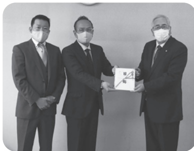
創業70周年記念事業