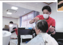
◀きぬの里内の美容室(木もれび)で ちょっとおめかしです