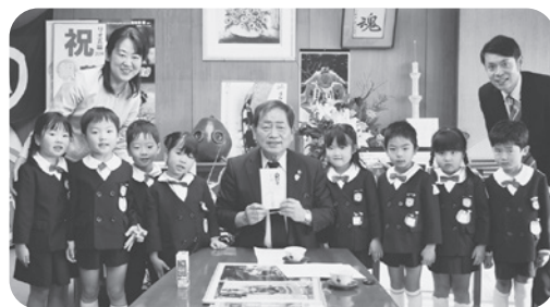
夕涼み会の物品販売