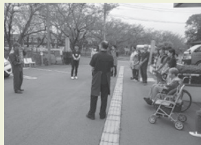
避難訓練行いました

提供可能サービス ・特別養護老人ホーム・デイサービスセンター ・ショートステイ ・居宅介護支援事業所