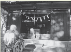
近くの神社に初詣にいきました