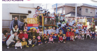
▲城東にここに保育園に 楽しみにしていた 遊具が整備されました