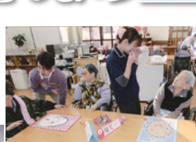
▲職員と会話が弾むひととき