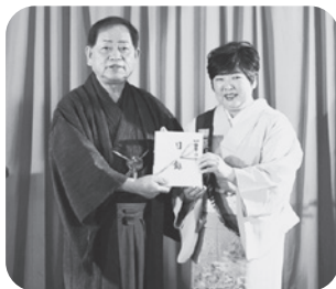
どんぐり基金寄付金として