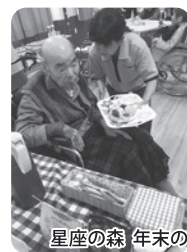
星座の森 年末のケーキバイキング