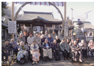
初詣に行ってきました