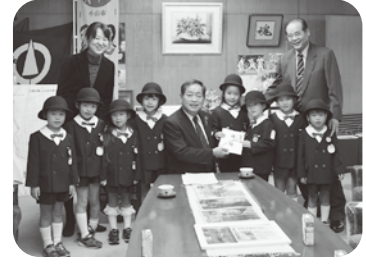
夕涼み会の物品販売