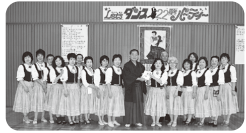
社会福祉活動への寄付