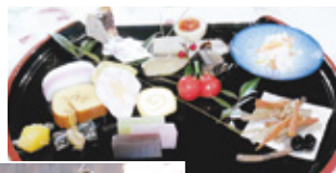
▲入居者の 皆さんが いただいたお節