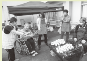
中庭で焼き芋をしました。