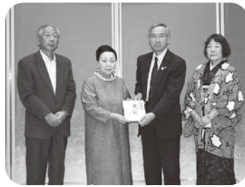
どんぐり基金寄付金として