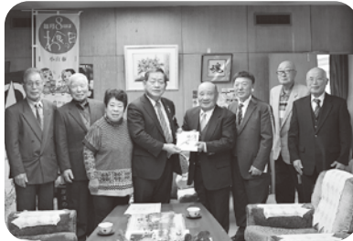
第24回大山歌謡教室発表会