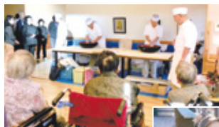
▲手打ちそばの実演 （おいしそう・・・）