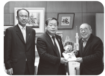
地域社会福祉の一助として