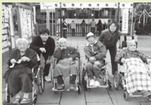
須賀神社に初詣に行きました。