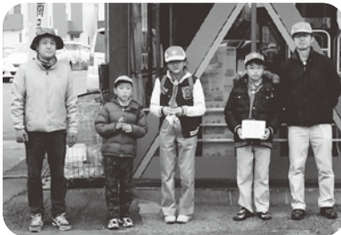
隊員による募金活動