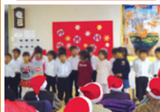
クリスマス会風景