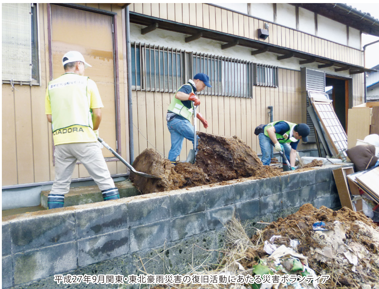
平成27年9月関東・東北豪雨災害の復旧活動にあたる災害ボランティア