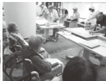
そば打ち 「そばにいこうかい」の訪問