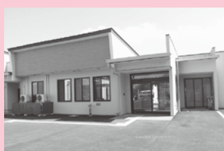
新しい施設ができました