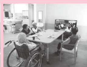
新しい施設のホールです