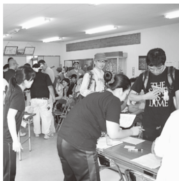
遠方では山形県・福岡県等から、多い方で8日間も活動に参加してくれた。