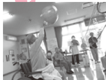
熱気みなぎる スポーツ大会