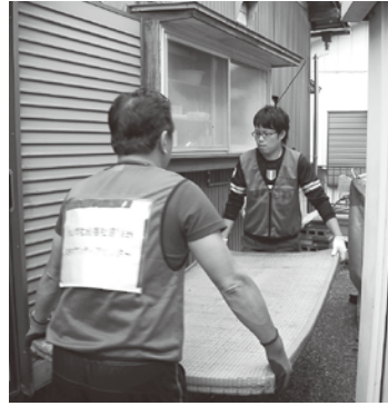
家具や畳の搬出、生活用品の片付け、室内の清掃等の依頼が多かった。

今回、いしがた災害ボランティアネットワーク（NSV.N）を始め沢山の方々から、資機材の応援、専門的なアドバイスをいただきました。