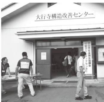
大行寺のサテライトセンター。9月23日(水)までの12日間開設した。

*サテライトセンターとは・・・出先の活動拠点のこと。被害の集中した地域やその周辺に活動拠点を設けることで、効果的・効率的に災害ボランティアを派遣し、復旧活動を進めることができる。