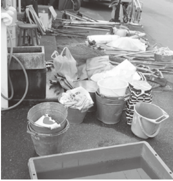
災害の種類や復旧活動の進み具合によって、必要な資機材も違ってくる。