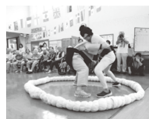
▲きぬの里大運動会