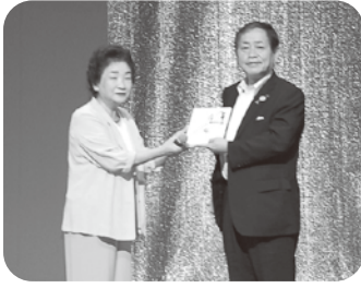
チャリティーカラオケ 発表会益金