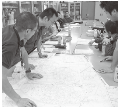
県内外の社会福祉協議会、NPO団体等から、沢山のスタッフが応援に来てくれた。

市内の被災者・避難者の情報、市の災害復旧活動の情報収集、ボランティア活動の情報発信等を行いました。