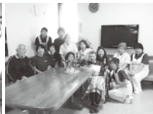
誕生日おめでとう ございます