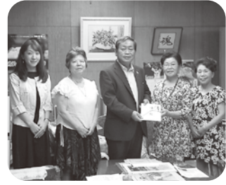
どんぐり基金寄付金として