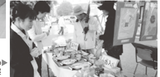
絹ふれあいの郷での デイサービス作品展