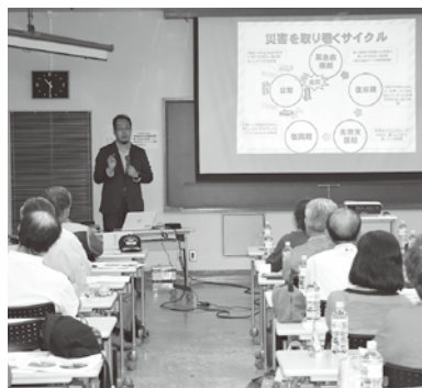
7月4日(土)に開催した災害ボランティア養成講座。災害時を想定し、意見交換を行った。

今回の経験からマニュアルの検証・見直しを行い、災害時に機能できる体制の整備に努めていきます。