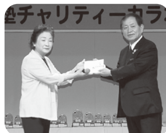
チャリティーカラオケ 予選会益金