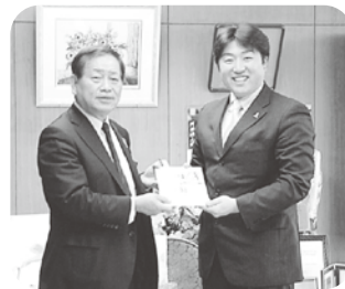
福利厚生のために設置した 自販機の益金