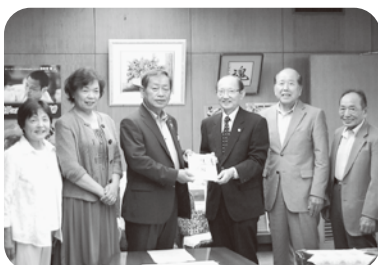
第13回チャリティー発表会益金