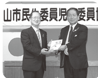
地域福祉活動の一助として