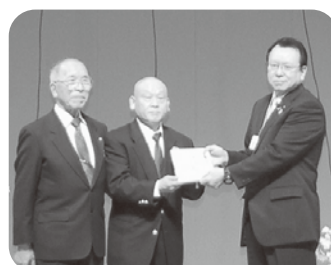
第4回思川桜歌謡祭 チャリティー発表会益金