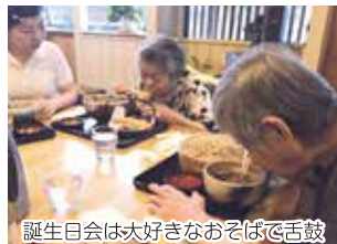
誕生日会は大好きなおそばで舌鼓