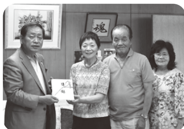
カラオケチャリティー発表会益金