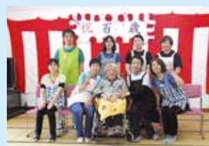
100歳の御祝をしました。

提供可能サービス ・特別養護老人ホーム・デイサービスセンター ・ショートステイ ・居宅介護支援事業所 〒323-0063 栃木県小山市大字上石塚15番地 TEL 0285-38-3232 FAX 0285-38-2138