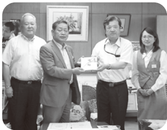
アルミ缶回収チャリティー分