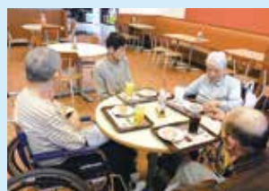
外出先でおやつを頂きました。