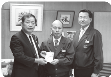
どんぐり基金寄付金として