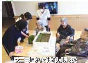
ミニ田植えを体験しました